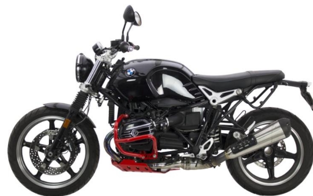
ALUMINUM TRAIL CRASH BAR Ref.: 2CP1970043