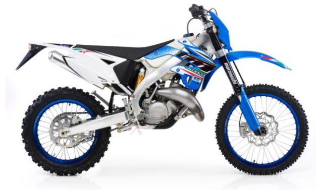
ALUMINUM EC ENGINE GUARD TM RACING EN 125/144 2T 2008-2015 Ref.: 2CP0590041