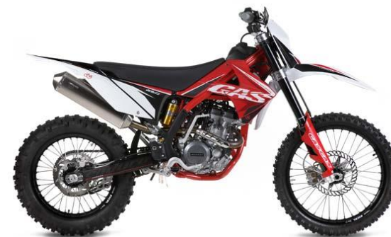
AL EC ENGINE GUARD GASGAS EC 250F 2010-2011 Ref.: 2CP0590052