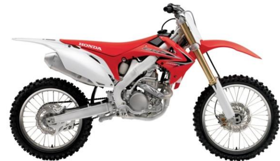
ALUMINUM EC ENGINE GUARD HONDA CRF 250R 2011-2013 Ref.: 2CP0590075