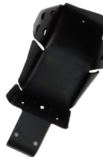
DTC HARD EC ENGINE and LINK GUARD HUSQVARNA FC 250/350 2019-2020 KTM 250/350 SX-F/XC-F 2019-2020 Ref.: 2CP225188A